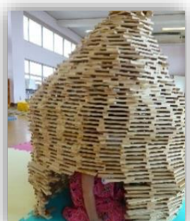
かまくら (人が入れるよ!)