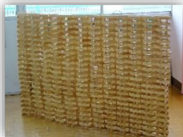
ナイアガラ (滝のように崩れる時の音も 素敵です)