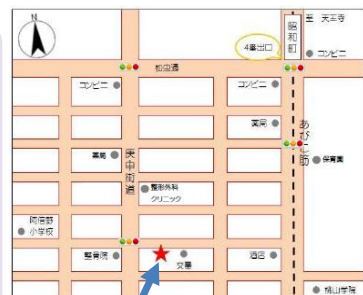
阿倍野区子ども・子育てプラザ